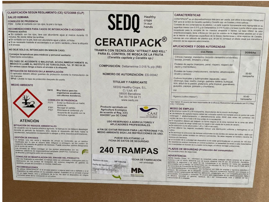
Ilustración 1. CAJA DE 240 UNIDADES.

Los campos en rojo son los campos que hay que declarar en RETO, junto con la cantidad total de la transacción o con el número de envases (número de blísters de 20 trampas que estamos vendiendo). También nuestro sistema tiene que saber que artículos son los que deben ir a RETO y al registro de transacciones, debe ser capaz de discriminar los artículos que son PPF de uso profesional que van en un mismo albarán y poder mandarlos al registro de transacciones y a RETO.